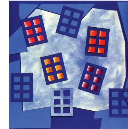
Finestre nel piano / 2000